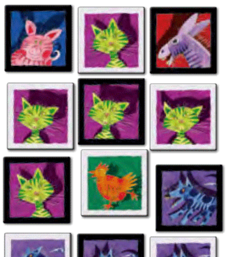
1. «Бим бамм!» с кошками.

Каждый игрок пытается сделать так, чтобы на столе оказалось пять квадратных карточек с изображением животного, нарисованного на его карте. Если такое случается, он должен как можно быстрее воскликнуть « Бим бамм! », чтобы выиграть свою карту.