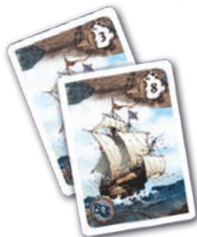
Игрок Б: ценность флота 3+8