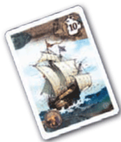
Игрок А: ценность флота 10