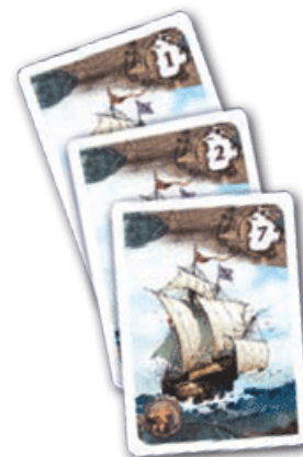
Игрок В: ценность флота 1+2+7

В игре участвуют 6 каравелл. После того, как игроки получают по 5 закрытых карт, в центр стола должны быть открыто выложены 6 единиц товаров.