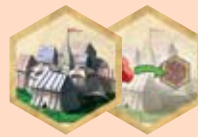
Оборотная и лицевая стороны

Жетон кочевников позволяет своему владельцу выполнить одно дополнительное действие. И игрок может выполнить его только во время следующего раунда (не того, в котором жетон был взят). В конце этого следующего раунда уберите жетон кочевников из игры – вне зависимости от того, использовался он или нет!