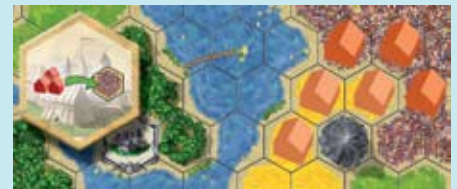
Выполнив основное действие, игрок строит 3 дополнительных поселения в цветочных полях.

Примечание. Если эти 3 поселения построены в воде или в горах, они не приносят золотые по картам «Рыбаки» (Fishermen) и «Шахтёры» (Miners).