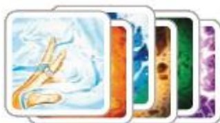
6 колец Всевластия

Приносят количество очков, равное квадрату найденного вами числа колец. То есть, если у вас только 1 кольцо, вы получите 1 победное очко. А если 3 – то 9 победных очков.