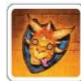
1 военный трофей

Приносит по 2 победных очка за каждого вашего монстра (по 1 очку при игре вдвоём).