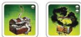
2 проклятых сундука

Отнимают столько победных очков, сколько черепов на них указано.