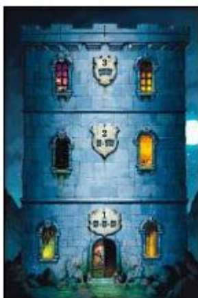
1 трёхэтажная башня