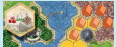
Выполнив основное действие, игрок строит 3 дополнительных поселения в цветочных полях.

Примечание. Если эти 3 поселения построены в воде или в горах, они не приносят золотые по картам «Рыбаки» (Fishermen) и «Шахтёры» (Miners).