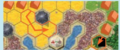
Игрок перемещает своё поселение на 3 области и забирает жетон кочевников. Затем перемещает другое поселение на одну область.

Переместите от 1-го до 4-х поселений в свободные соседние области, пригодные для строительства. Общее число перемещений – не больше 4-х. В результате перемещений поселения игрока могут отделиться от его других поселений. Это действие вы можете выполнить до или после своего основного действия.