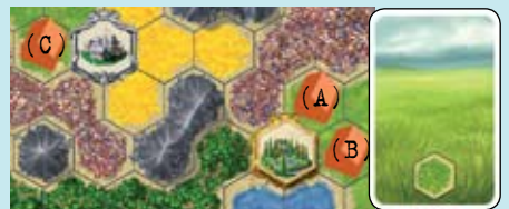
Игрок строит поселения А и В рядом с локацией, а затем использует заставу и строит поселение С рядом с кочевниками.

Тем не менее, поселения всё равно должны строиться в областях указанного типа местности.