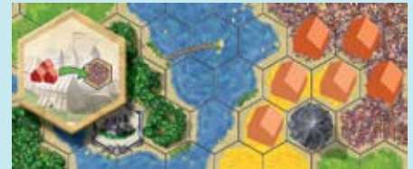
Выполнив основное действие, игрок строит 3 дополнительных поселения в цветочных полях.

Примечание. Если эти 3 поселения построены в воде или в горах, они не приносят золотые по картам «Рыбаки» (Fishermen) и «Шахтёры» (Miners).