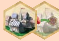
Оборотная и лицевая стороны

Жетон кочевников позволяет своему владельцу выполнить одно дополнительное действие. И игрок может выполнить его только во время следующего раунда (не того, в котором жетон был взят). В конце этого следующего раунда уберите жетон кочевников из игры – вне зависимости от того, использовался он или нет!